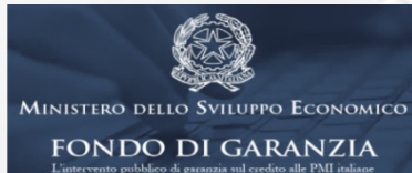
Fondo di Garanzia PMI