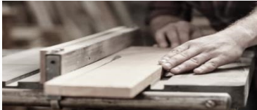
L. 949/52 artigianato