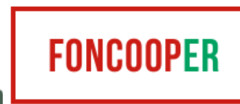
Foncooper Emilia Romagna